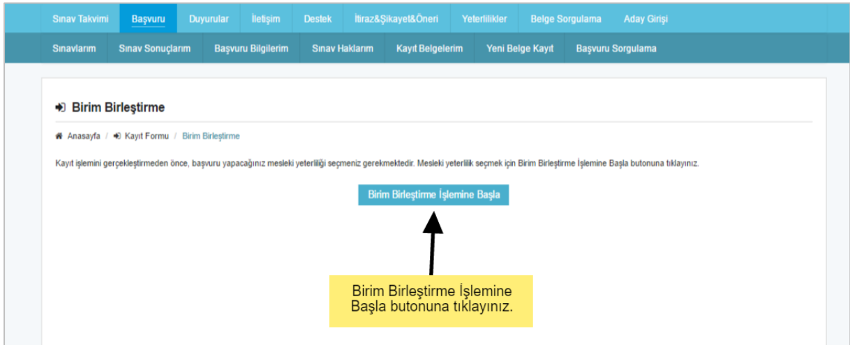
Ek-5 : Birim Birleştirme Başvurusu

Daha önce başka bir kuruluştaki belge başvurusu yaptıysanız ve geçtiğiniz birimleri kanıtlayarak belgelendirme işleminize devam etmek istiyorsanız” Birim Birleştirme ” butonuna tıklayınız.